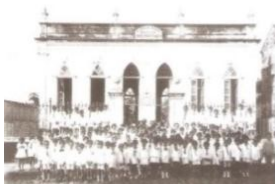
Figura 4: Antigo Grupo José Paranaguá, na década de 1920.